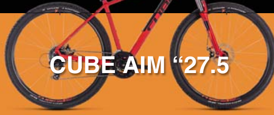
CUBE AIM "27.5