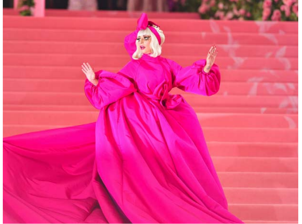
Lady Gaga vekur auðvitað alltaf athygli. Á þessu sinni mætti hún í skærbleikum kjól.