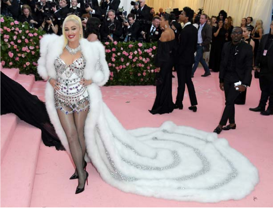
Gwen Stefani er glæsileg í silfri og hvítri skikkju sem liggur eins og slöð á brúðarkjól.