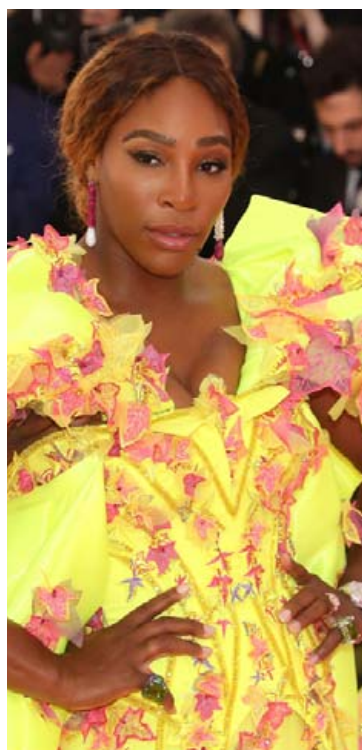
Tennisstjarnan Serena Williams var sannarlega í gleðilegum sumarkjól sem gagnrýnendur sögðu vera eins og eggjæræru með skinkubitum.

Metropolitan Museum of Art eða Met Museum, eins og það er venjulega kallað, er eitt af frægustu söfnum í heimi. Þar eru sýnd listaverk sem sum hver eiga yfir 5.000 ára sögu. Á hverju ári heimsækja safnið yfir sjö milljónir manna. Þarna má finna verk eftir Leonardo da Vinci, Georgia O'Keeffe, Pablo Picasso, Monet, Van Gogh og marga fleiri snillinga fortíðarinnar.