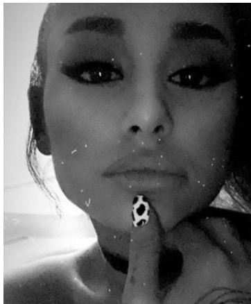
Ariana Grande birtir mynd á Instagram af skjöldóttum nöglum.