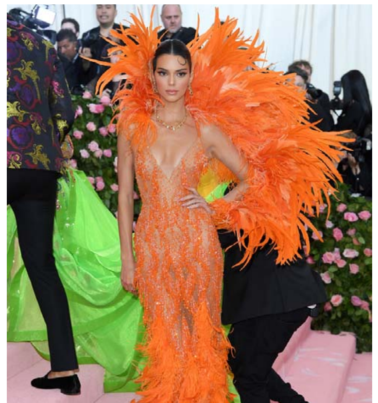
Fjaðraskraut var áberandi á hátíðinni. Kendall Jenner lét sitt ekki eftir liggja.