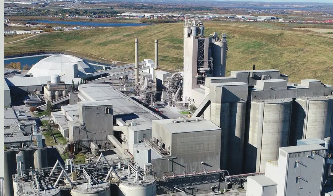
Dæmi um hvernig verksmiðjur Heidelbergts líta út: Sementverksmiðja fyrirtækisins í Edmonton, Kanada.