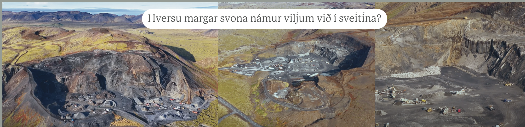
Lambafell - náma aðventista er ein af þrem í fellinu.

Hversu margar svona námur viljum við í sveitina?